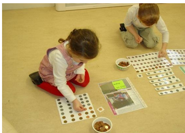
5-latki dokonują wyboru sprzętów na plac zabaw przy swoim przedszkolu. Dzieci korzystały z żetonów-monet, by szacować koszty poszczególnych zabawek.

Od początku pilotażu, tj. od roku 2006, młodzi ludzie z Newcastle współdecydowali o wydatkowaniu ponad 3,8 miliona funtów z lokalnego budżetu. W głosowaniach w ramach samego UDecide wzięło udział ponad 300 młodych ludzi, którzy zdecydowali o przeznaczeniu środków na realizację ponad 30 różnych projektów.