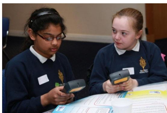
Głosowanie z wykorzystaniem narzędzi elektronicznych

Po podjęciu decyzji przez „dorosłych” decydentów, każdy uczeń-uczestnik spotkania otrzymał od organizatorów list, w którym informowano o ostatecznym wyborze projektów do realizacji.