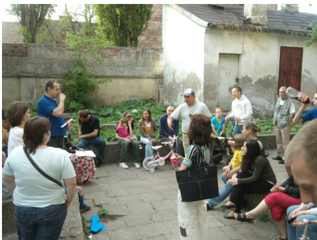
Fot. 2 Spotkanie z mieszkańcami na podwórku przy ul. Stalowej 27, 10 maja 2011 r.

Przez kolejne dni architekci (wzbogaceni o wiedzę z wywiadów oraz zbiorowych spotkań z mieszkańcami) pracowali nad projektami odnowy podwórek, które 14 maja jeszcze raz zostały poddane pod dyskusję z mieszkańcami, którzy zgłaszali do nich swoje uwagi.