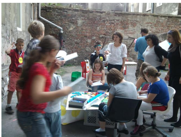
Fot. 1 Warsztaty z dziećmi na podwórku przy ul. Środkowej 12, 10 maja 2011 r.

Wszystkie te działania odbywały się w przestrzeni podwórek, aby uczestnicy procesu pozostawali osadzeni w kontekście analizowanych przestrzeni. Ich pomysły były na bieżąco rejestrowane.