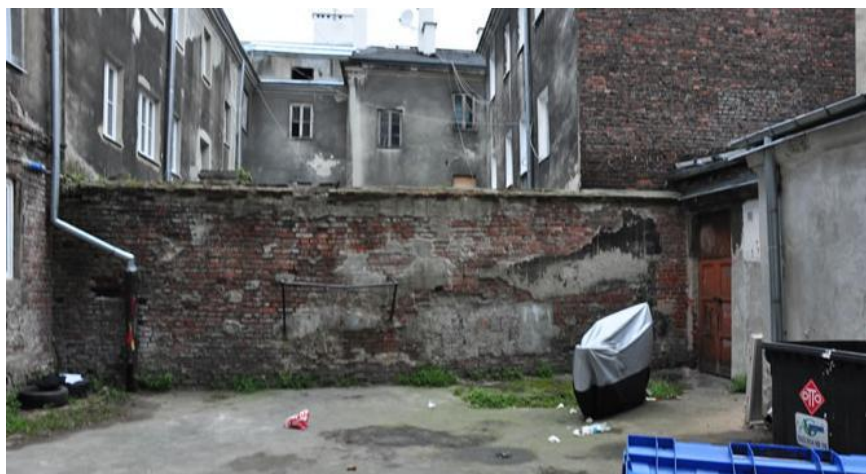
Fot. 1 Podwórko przy ulicy Środkowej 12 przed realizacją projektu odNOWA

Przestrzeń objęta projektem należą do najbardziej zaniedbanych w okolicy, zarówno pod względem architektonicznym, jak i społecznym. Przy Stalowej, pusta przestrzeń pomiędzy budynkami zastawiona jest przez samochody, używana jedynie przez osoby wyprowadzające psy. Podwórko przy Środkowej jest wewnętrznym dziedzińcem, ocienionym przez otaczające je budynki, pozbawionym zieleni. Na podwórko wchodzi się przez bramę.