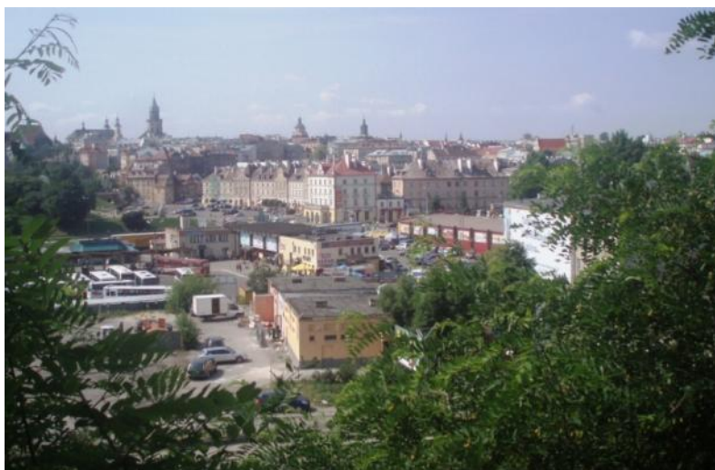
Widok na Stare Miasto ze wzgórza Czwartek

Pomysł rewitalizacji Podzamcza wziął się przede wszystkim z potrzeb miasta – aby zdegradowana przestrzeń w historycznym centrum miasta stała się jego pełnoprawną częścią, która w przeciwieństwie do dworca, przyciągać będzie ludzi nie tylko na chwilę, ale też będzie ich skłaniała do pozostania tam dłużej. Co istotne dla powodzenia tego przedsięwzięcia, ustalenia dotyczące dworca PKS stały się możliwe dopiero niedawno, gdy dokonały się zmiany własnościowe w przedsiębiorstwie. Otworzyło to drogę do podjęcia rozmów o przyszłości Podzamcza.