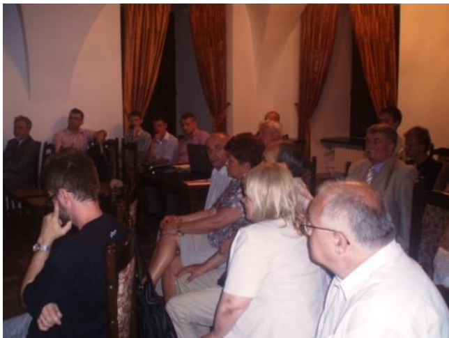
Uczestnicy spotkania, w czasie którego wręczono Prezydentowi Lublina wniosek do planu zagospodarowania przestrzennego Podzamcza

Wyniki konsultacji społecznych zebrano w formie dokumentu, zatytułowanego “Społeczny wniosek do miejscowego planu zagospodarowania przestrzennego Podzamcza” . Został on