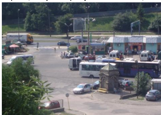
Widok na Dworzec PKS ze wzgórza Czwartek, na pierwszym planie zabytkowa studnia

Teren Podzamcza bardzo dobrze wpisuje się w projekt „Dziedzictwo jako szansa”. Jest położony w samym centrum miasta, pomiędzy Wzgórzem Zamkowym i Starym Miastem, a Wzgórzem Czwartek, z zabytkowym Kościołem św. Mikołaja. Obszar ten od czasów średniowiecznych zasiedlany był przez lubelskich Żydów, znajdowały się tam kamienice, Synagoga Maharszala. W czasie drugiej wojny światowej znajdowało się tam getto, które zostało zburzone przez Niemców. Z dawnej zabudowy pozostało ujęcie wody pitnej (zobaczyć je można do dziś na skraju placu manewrowego dla autobusów), a także zabytkowa cerkiew katedralna