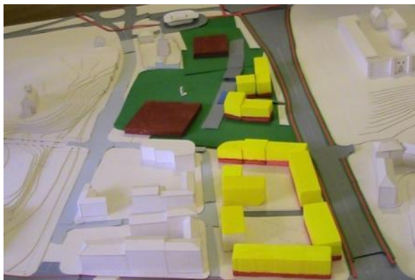
Jedna z koncepcji stworzonych w czasie konsultacji

Uczestnicy konsultacji podkreślali łatwość wyrażenia opinii, jaką daje makieta. Jak twierdził jeden z rozmówców: „Ktoś, komu brakuje wyobraźni przestrzennej, mógłby mieć problem z wyrażeniem swojej koncepcji. Układanie klocków nie tylko w tym pomaga, ale również jest bardzo fajne i można się przy tym nieźle bawić”.