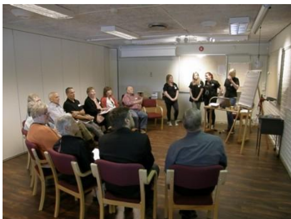
Spotkanie w jednej z grup seniorów prowadzone przez młodzież

którejsz organizacji emerytów, obecni byli również przedstawiciele gminy - politycy i urzędnicy.