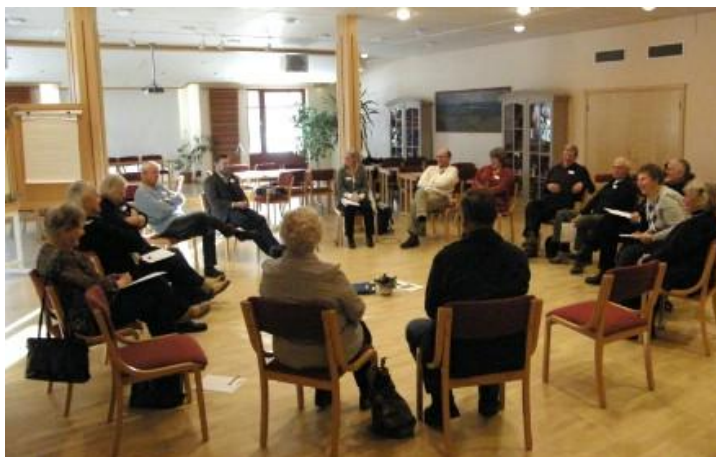
Spotkanie (hearing) po Dniu Demokracji

Po zakończonym Dniu Demokracji, plany działania zostały przekazane Radzie Gminy, która rozesłała poszczególne postulaty do odpowiednich jednostek gminy. Następnie, po paru miesiącach, odbyło się spotkanie (hearing), na którym seniorzy mogli jeszcze raz dogłębnie przedyskutować swoje plany działania oraz dowiedzieć się co gmina zrobiła/zamierza zrobić w odpowiedzi na przedstawione postulaty.