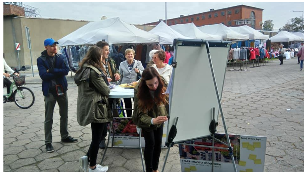
Punkt konsultacyjny: targowisko miejskie 17 września 2019 r.