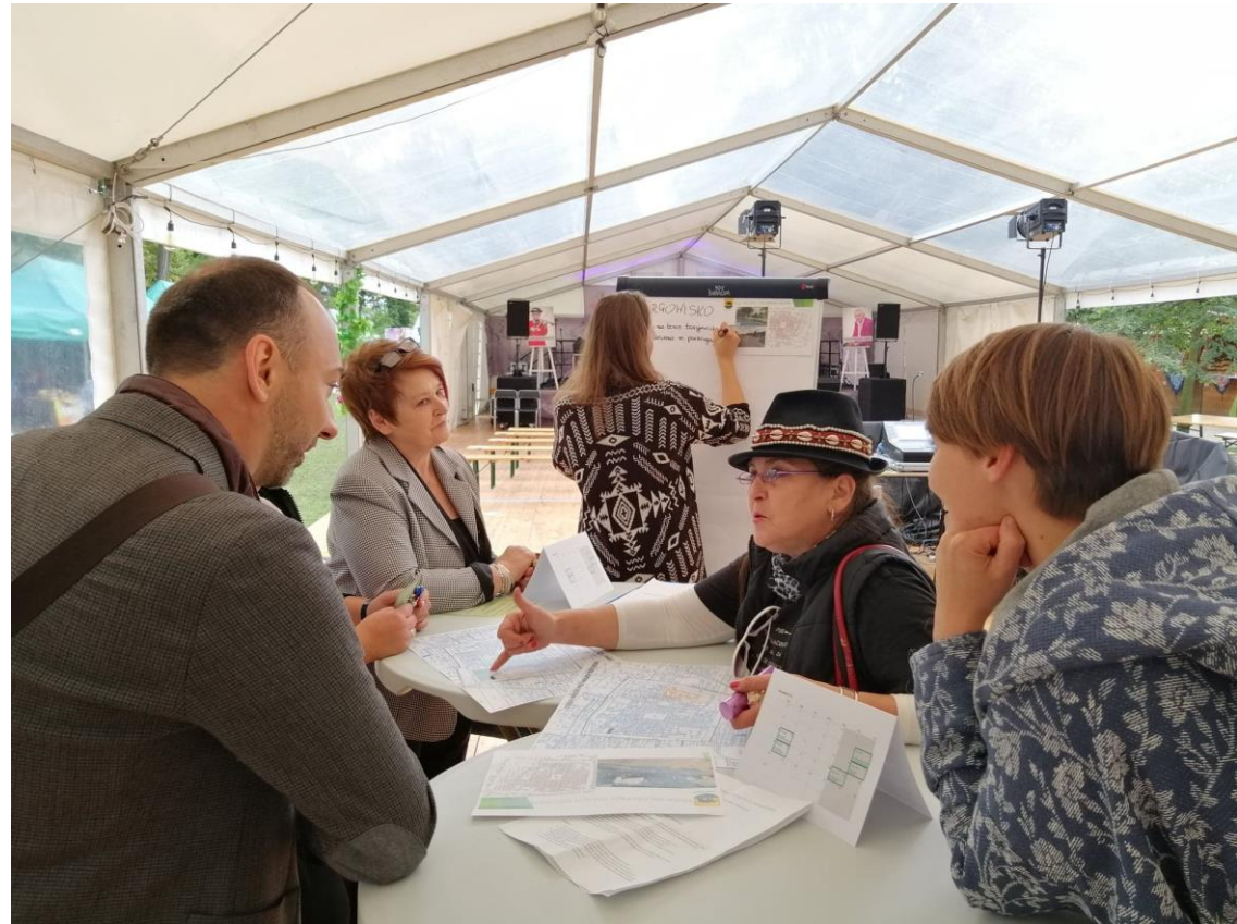
Spotkanie otwarte w formule World Café podczas Rawickiego Jarmarku Historycznego 8 września 2019 r.