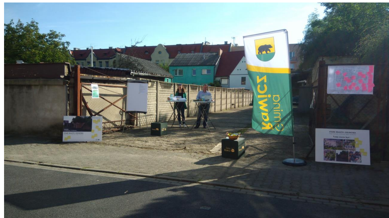
Punkt konsultacyjny: bunkier przy ulicy Podzamcze 15 września 2019 r.