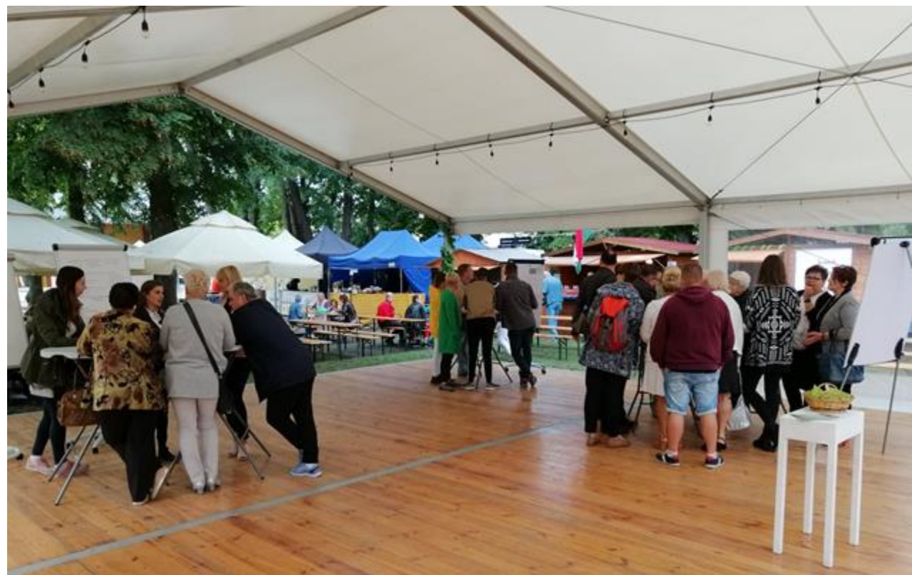
Spotkanie otwarte w formule World Café podczas Rawickiego Jarmarku Historycznego 8 września 2019 r.