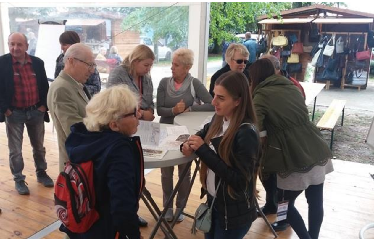
Spotkanie otwarte w formule World Café podczas Rawickiego Jarmarku Historycznego 8 września 2019 r.