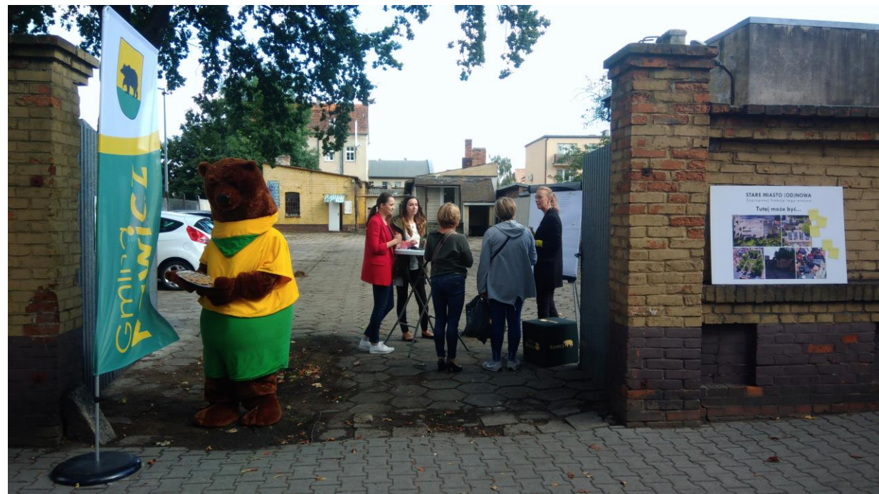
Punkt konsultacyjny: teren miejski przy Wałach Kościuszki 10 września 2019 r.