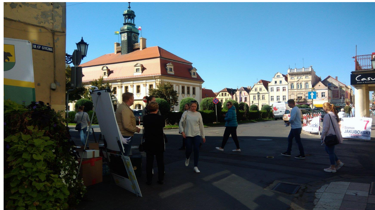
Punkt konsultacyjny: kamienica Rynek 9 (Staromiejska) 21 września 2019 r.