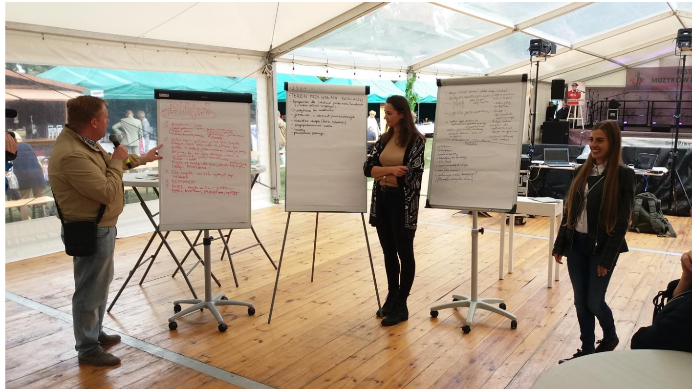
Podsumowanie spotkania w formule World Café podczas Rawickiego Jarmarku Historycznego 8 września 2019 r.

http://bip.rawicz.pl/artikuly/907/miejscowe-plany-zagospodarowania-przestrzennego-od-roku-2018