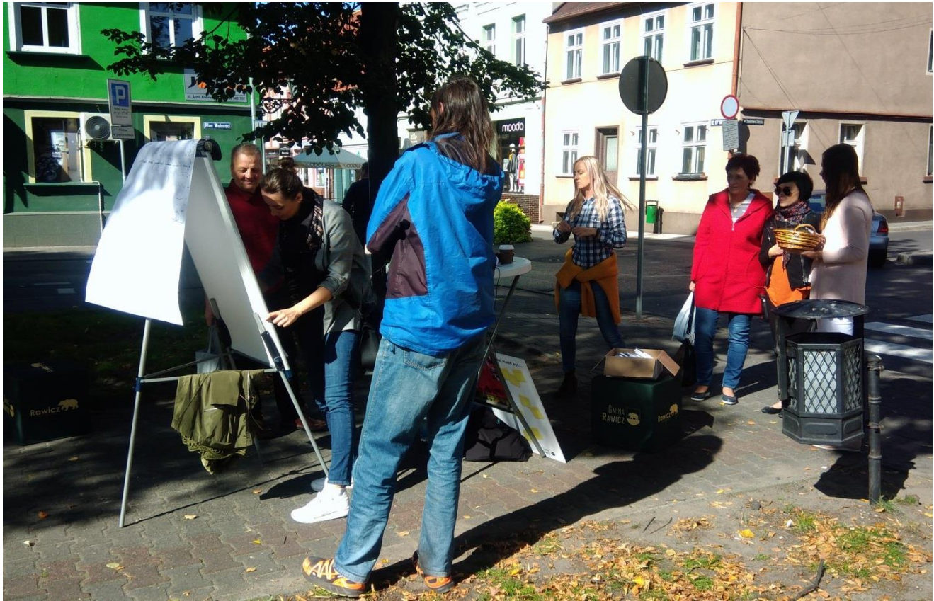
Punkt konsultacyjny: Plac Wolności 21 września 2019 r., fot. Joanna Lewandowska