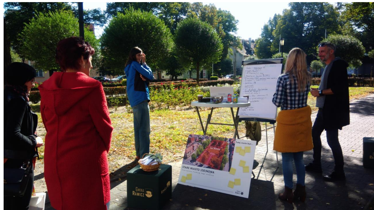
Punkt konsultacyjny: Plac Wolności 21 września 2019 r.