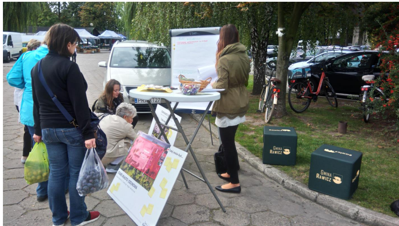
Punkt konsultacyjny: targowisko miejskie 17 września 2019 r.

W badaniu ankietowym zostały zebrane odpowiedzi w przewyższającej liczbie od osób młodych oraz osób do 55 roku życia.