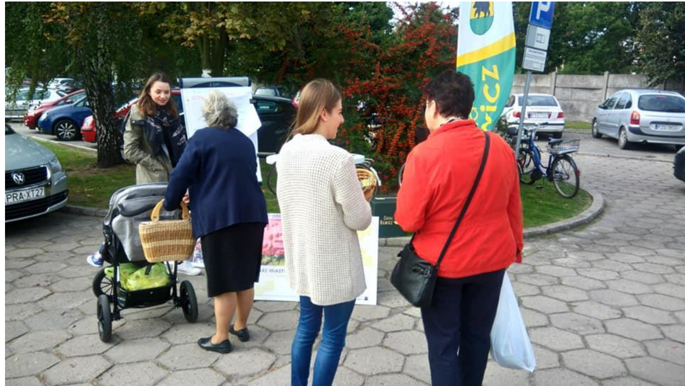
Punkt konsultacyjny: targowisko miejskie 17 września 2019 r.